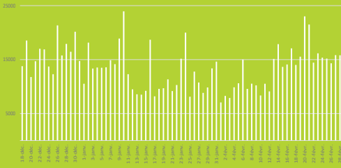
Excursionnisme dans les stations de l'Ain en 2021